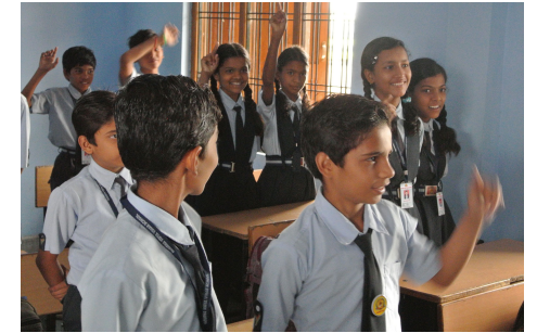
フェアトレードプレミアム（奨励金）で建てられた綿花農園の近くの小学校と子どもたち 「フェアトレードがつくる夢」YouTubeにて公開中